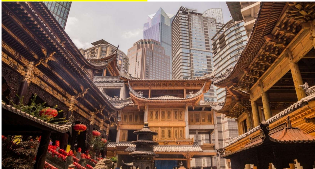
T2G-CKG36FD ฉางชิ่ง กวงอู๋ชาน...วัดหลัวฮั่น ต้าจู่ ชมถนนแปะก๊วย 5D 4N (FD)