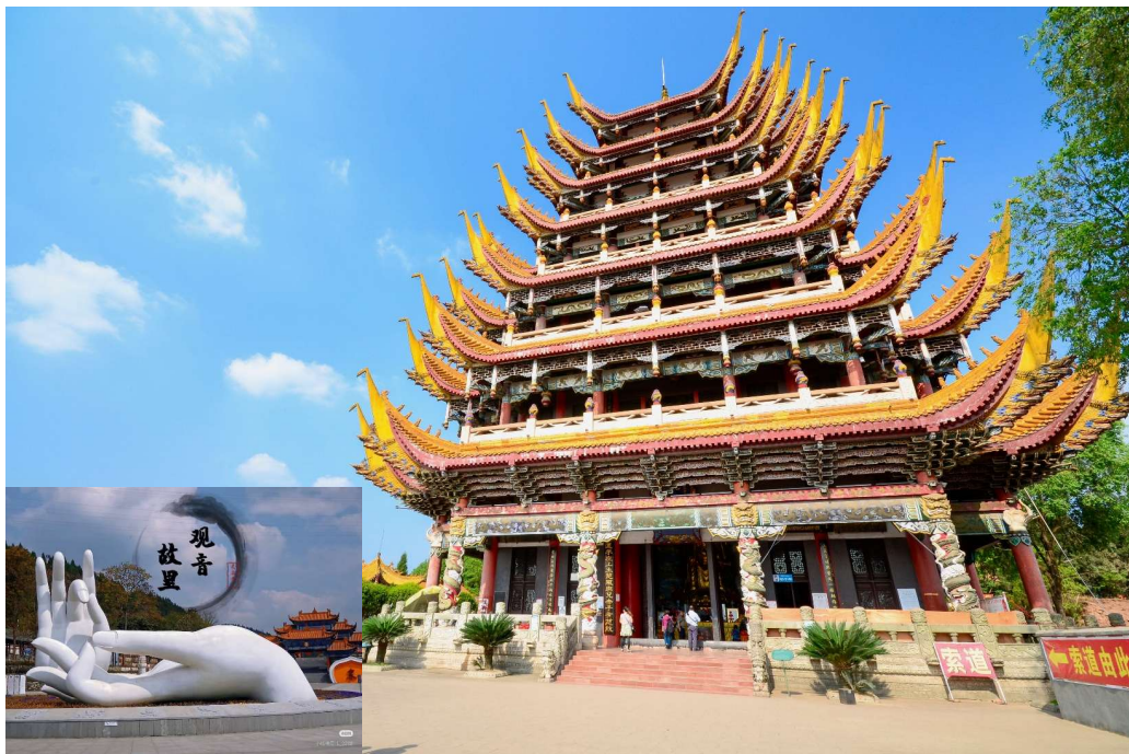
T2G-CKG36FD ฉงชิ่ง กวงชู่ชาน...วัดหลิงฉวน ต้าจู่ ชมถนนแปะก๊วย 5D 4N (FD)

จากนั้นนำท่านเดินทางสู่ วัดหลิงฉวน (Lingquan Temple) หรือ วัดเจ้าแม่กวนอิมกระพริบตา เป็นวัดเก่าแก่ซึ่งสร้างขึ้นในปลายราชวงศ์สุย (ค.ศ. 581 - 618) และบูรณะพัฒนาต่อเนื่องมา มีความเชื่อว่าเป็นวัดที่มีความศักดิ์สิทธิ์อย่างมาก มีเรื่องเล่ากันว่า เมื่อครั้งเกิดแผ่นดินไหวที่มณฑลเสฉวน ชาวบ้านที่มาสักการะเห็นเจ้าแม่องค์นี้ได้กระพริบตาและหลั่งน้ำตา เสมือนท่านส่งสารชาวผู้ประสบภัย ภายในวัดแห่งนี้ยังได้แสดงประวัติของเจ้าแม่กวนอิม วิหารเจ้าแม่กวนอิม ภายในวิหารเจ้าแม่กวนอิม มืองค์เจ้าแม่กวนอิมยืนสูง 18.6 เมตร