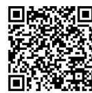
สแกน QR Code เพื่อรับชมบรรยากาศใน OUTLET