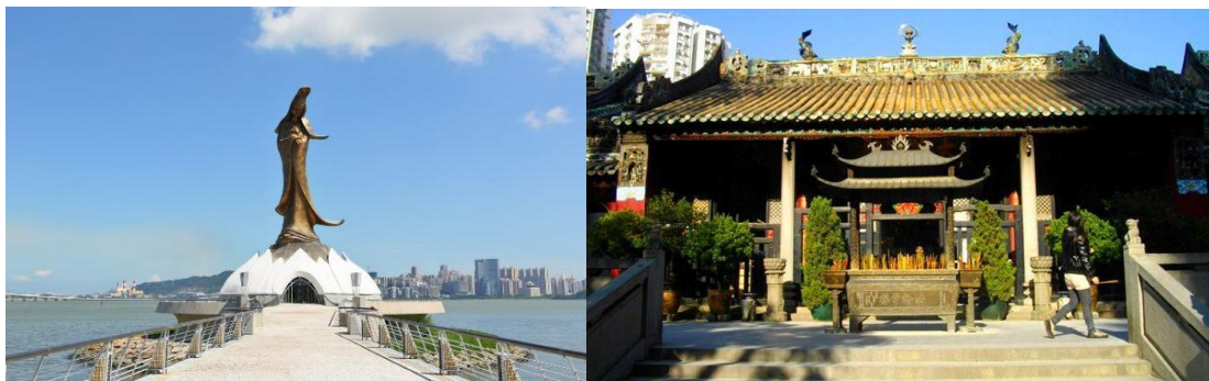
เจ้าสาวของจีนที่ตัดเย็บด้วยผ้าไหมอย่างงดงาม

จากนั้นนำท่านชม วัดเจ้าแม่กวนอิม (Kun Iam Temple) ถือเป็นการไหว้พระเอาฤกษ์เอาชัย เพราะวัดแห่งนี้เป็นวัดใหญ่และเก่าแก่ที่สุดในมาเก๊า สร้างขึ้นตั้งแต่สมัยศตวรรษที่ 13 ภายในวัดสัมผัสได้ถึงความรู้สึกดีสิทธ์และมนต์ขลังอันเก่าแก่ของสถาปัตยกรรมของ ชาวจีนที่ดูมีเสน่ห์ในแบบฉบับของชาวจีน ซึ่งภายในวัดแห่งนี้มีพระพุทธรูปที่ชาวมาเก๊าเคารพนับถืออยู่หลายองค์ ไม่ว่าจะเป็นพระพุทธรูปพระพุทธรูปเจ้า 3 ยุค ที่มีประดิษฐานอยู่ด้วยกัน 3 องค์ ซึ่งสะท้อนให้เห็นถึงปรัชญาทางพระพุทธศาสนาที่ว่าในอดีต ปัจจุบัน และอนาคตมีพระอยู่ ที่คนมาเก๊าให้ความเคารพนับถือมากราบไหว้ขอพรกันเยอะ และองค์ที่โดดเด่นเป็นพิเศษเห็นจะเป็นองค์เจ้าแม่กวนอิมที่แต่งองค์ทรงเครื่องด้วยชุด