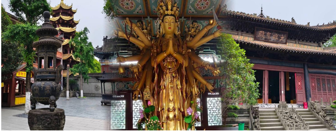
กลางวัน ทานอาหารกลางวัน ณ ภัตตาคาร

เจ้าแม่กวนอิมเป็นองค์ประธานของวัดแห่งนี้ โดยมี รูปหล่อพระโพธิสัตว์ขนาดใหญ่ ประดิษฐานในหอหลัก ผู้คนมักมากราบไหว้ ขอพร ด้านความรัก การงาน การเรียน และการเดินทางปลอดภัย