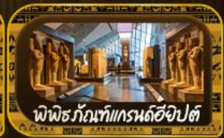
พิพิธภัณฑ์แกรนด์ฮิออปต์