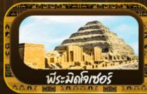
พีระมิดคิฟเร