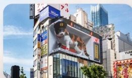
ซูปป์ิงชินจุกุ