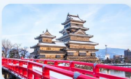
ปราสาทมิตสึโมโตะ