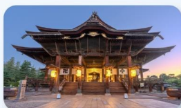
วัดเซ็นโคจิ นากาโนะ