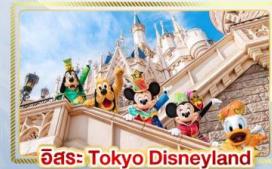
อีส: Tokyo Disneyland