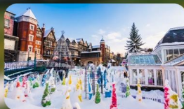
โรงงานช็อกโกแลต ชิโรอิ โคอิบิโตะ