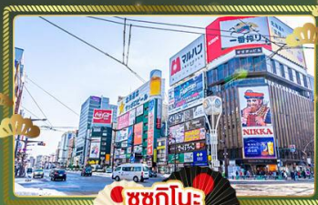
ซูชิโกโนะ