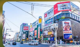
ซูซุกิโนะ