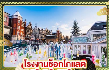
โรงงานช็อกโกแลต ชิโรอิ โคอิบิตะ