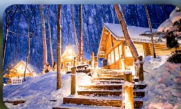
นิงเกิลเทอเรซ

Sapporo Tokyu REI หรือเทียบเท่ามาตรฐานญี่ปุ่น