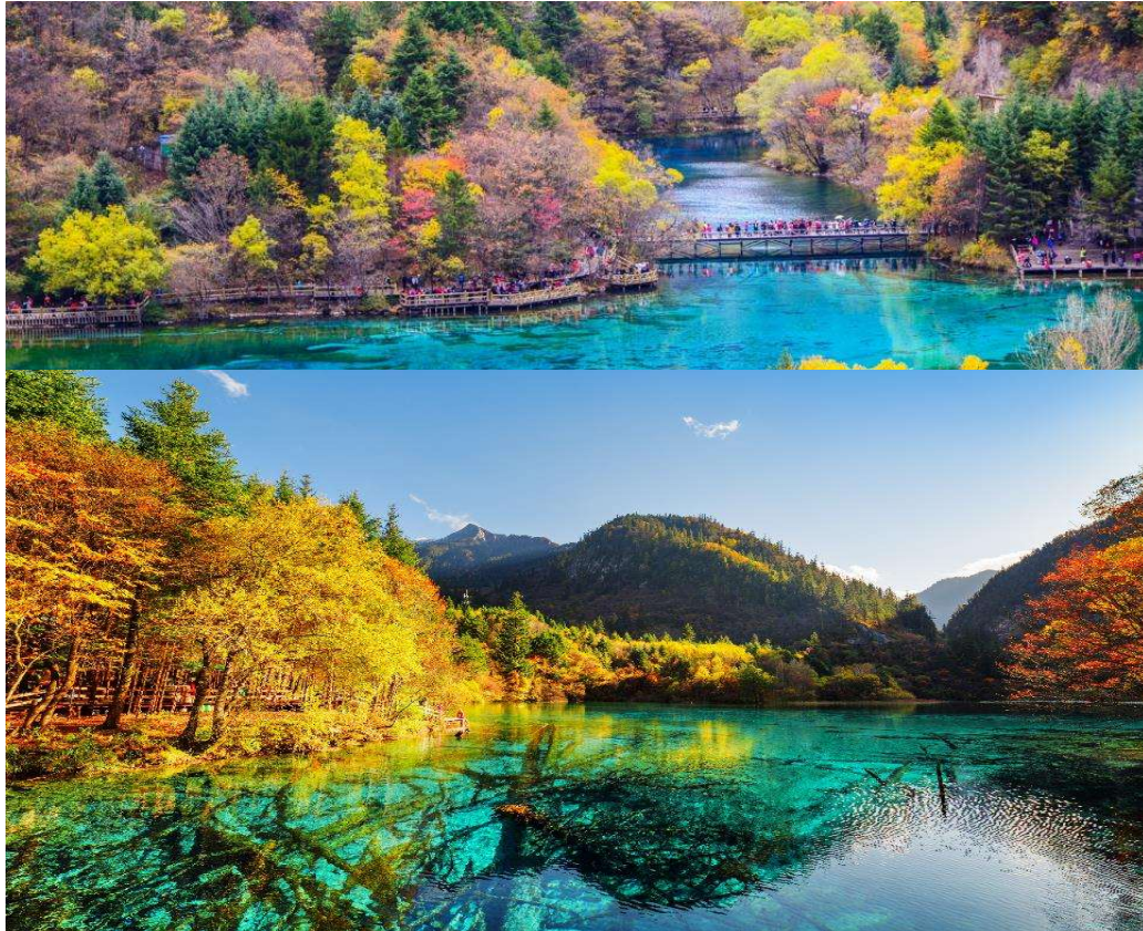
T2G-TFU34(3U) Famous of Chengdu จิวจ้ายโกว หวงหลง สี่ดรุณี 6D 5N (3U)

นำท่านชม ทะเลสาบมังกรคู่ ซึ่งชื่อของทะเลสาบนี้มาจากแนวหินปูนกั้นทะเลสาบที่มีรูปร่างเหมือนมังกรสองตัว จากนั้นนำท่านชม ทะเลสาบยาว ใหญ่ที่สุดในจิวจ้ายโกว ยาวกว่า 7 กิโลเมตรอยู่ท่ามกลางขุนเขาในบรรยากาศที่เงียบสงบแต่งดงาม ชม ทะเลสาบห้าสี เป็นทะเลสาบที่มีสีของน้ำแปลกตาโดยเฉพาะเมื่อยามแสงอาทิตย์ตกกระทบพื้นน้ำ สีของน้ำในทะเลสาบจะเปล่งประกายเปลี่ยนร่างเป็นสีรุ้งดั่งดงาม