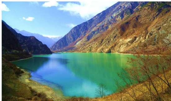
T2G-TFU34(3U) Famous of Chengdu จิวจ้ายโกว หวงหลง สี่ดรุณี 6D 5N (3U)

จากนั้นชม ทะเลสาบเตี้ยซีใหญ่ ซึ่งเป็นทะเลสาบที่มีผิวน้ำราบเรียบขาวใส ดูกระจกเงา ตามตำนานที่เล่าขานกันมาว่า ทะเลสาบแห่งนี้เกิดจากแผ่นดินไหว ทำให้หมู่บ้านทั้งหมดจมอันตรธานหายไปทันที และความงามที่เห็นอยู่นี้เป็นความงามที่เกิดจากความหายนะ