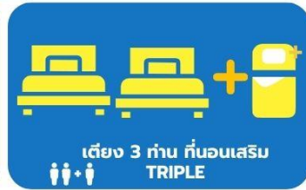
เตียง 3 ท่าน คั่นนอนเสริม TRIPLE