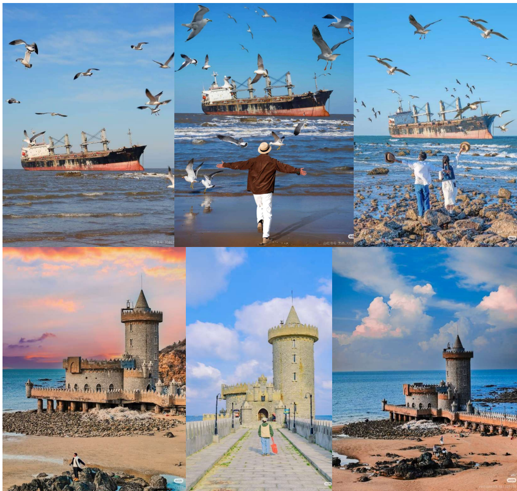
T2G-DLCTA001CZ สองเรือข้ามอ่าว ดำเหลี่ยม ชิงเต่า...เหยียนโด เว่ยไห่ เิงไห่ 6D 5N (CZ)

จากนั้นนำท่านชม เรือบลูวิส เรือบรรทุกสินค้าขนาดความยาว 190 เมตร ที่ถูกพายุได้ฝุ่นถล่มทำให้เรือยักษ์นี้ เกยตื้น เกิดเป็นศิลปะกลางทะเลสุดคูล! ที่ดึงดูดให้นักท่องเที่ยวทุกมุมโลกมาดำช้ำกับเรือลำนี้ 1บอกเลยว่า... มาที่เว่ยไห่ต้องไม่พลาด "เรือบลูวิส (Bluevis)" เด็ดขาด! จากอุบัติเหตุ... กลายเป็นแลนด์ มาร์กสุดอาร์ตแบบที่หาไม่ได้ที่อื่น จุดถ่ายรูปสุดโดดเดี่ยวแต่โรแมนติกในเว่ยไห่