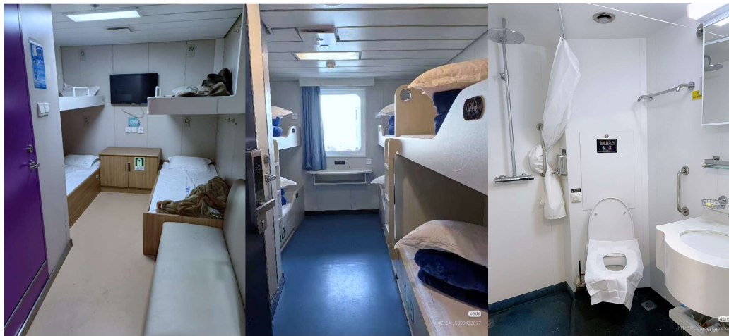
T2G-DLCTA001CZ ล่องเรือข้ามอ่าว ต้าเหลียน ชิงเต่า...เหยียนโก เว่ยไห่ เฝิงไห่ 6D 5N (CZ)

การเช็คเอาท์ พนักงานจะเริ่มเคาะประตูปลูกประมาณ 04.30 - 05.00 น. เพื่อเตรียมตัวลงเรือ