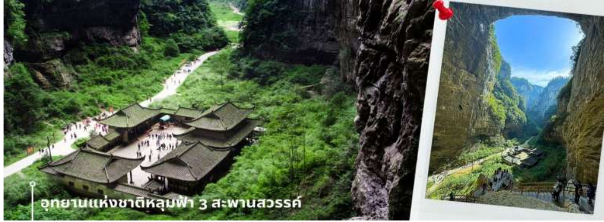
CHUCKG5 ฉงชิ่ง อู่หลง หลุมฟ้า ดำจู่ หยงหยาดัง 5 วัน 4 คืน บิน HAINAN AIRLINES (HU) หน้า 3

เช้า รับประทานอาหารเช้า ณ ห้องอาหารของโรงแรมที่พัก (2) หลังรับประทานอาหารเช้า นำท่านเดินทางสู่ เมืองอู่หลง (ใช้เวลาเดินทางประมาณ 3 ชั่วโมง) จากนั้นนำท่านเข้าชม อุทยานแห่งชาติหลุมฟ้า 3 สะพานสวรรค์ (รวมลิฟท์แก้ว+รถอุทยาน+รถแบดเตอร์+ระเบียงกระจก) เป็นมรดกโลกทางธรรมชาติระดับ 5A ที่มีความสวยงามมากที่สุดแห่งหนึ่ง ตั้งอยู่ที่เมืองอู่หลง นครฉงชิ่ง ประเทศจีน เกิดจากการยุบตัวของเปลือกโลก ทำให้เกิดเป็นบ่อหลุมขนาดใหญ่ที่ลึกประมาณ 300-500 เมตร และมีบางส่วนเป็นโพรงทะลุ เหมือนกับสะพานทอดข้ามระหว่างภูเขาจึงเป็นที่มาของคำว่า "หลุมฟ้า 3 สะพานสวรรค์" การลงไปหลุมฟ้าจะต้องลงลิฟท์