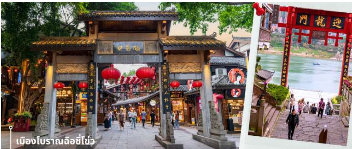
เมืองโบราณฉือโข่ว

หลังจากนั้นนำทุกท่านเดินทางสู่ เมืองโบราณฉือโข่ว เมืองโบราณและสถานที่ท่องเที่ยวชื่อดังในมหานครฉงชิ่ง ประเทศจีน ที่อนุรักษ์สถาปัตยกรรมและวิถีชีวิตดั้งเดิมไว้และได้เป็นสถานที่ท่องเที่ยวระดับ 4A ของจีน ประวัติศาสตร์ยาวนาน มีลักษณะคล้ายตลาดเก่าโบราณริมแม่น้ำเจียวหลิง เป็นแหล่งรวมของชนม ของกินพื้นเมือง ของฝาก รวมถึงมีวัดและร้านค้ามากมาย ให้ความรู้สึกเหมือนได้ย้อนเวลากลับไปในอดีต ภายในพื้นที่เต็มไปด้วยร้านค้าเก่าแก่ที่ขายทั้งอาหารพื้นเมือง ของกิน และของฝากมากมาย ทั้งยังมีการแสดงวัฒนธรรมพื้นบ้านให้นักท่องเที่ยวได้ชม ให้ความรู้สึกเหมือนหลุดเข้าไปในซีรีส์จีนย้อนยุค ที่เที่ยวฉงชิ่ง ที่เหมาะแก่การมาเดินเที่ยว ชิมอาหาร ถ่ายรูป และสัมผัสวิถีชีวิตแบบดั้งเดิมของชาวฉงชิ่งอย่างใกล้ชิดในบรรยากาศที่แสนสบาย