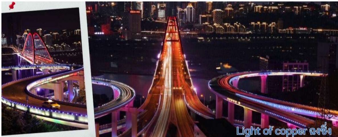
Light of copper ฉงชิ่ง

แวะถ่ายรูปวิวที่ Light of copper ฉงชิ่ง เป็นจุดชมวิวชื่อดังในมหานคร ฉงชิ่ง ประเทศจีน ซึ่งได้รับความนิยมอย่างมากในกลุ่มนักท่องเที่ยวและช่างภาพ จุดชมวิวทางยกระดับโดดเด่นด้วยทางเดินลอยฟ้าทรงกลมที่เชื่อมต่อกันสามารถมองเห็นวิวพาโนรามาของ สะพานซูเจียป่า (Sujiaba Interchange) ที่โค้งไปมาอย่างซับซ้อน และสะพานข้ามแม่น้ำแยงซีเกียง ไช่หยวนป่า (Caiyuanba Bridge) ท่ามกลางตึกสูงระฟ้าบรรยากาศยามค่ำคืน เมื่อเปิดไฟเมืองในช่วงค่ำจะเห็นแสงสีทองและสีทองแดงสะท้อนความงดงามของ "เมืองภูเขา" ได้อย่างชัดเจน