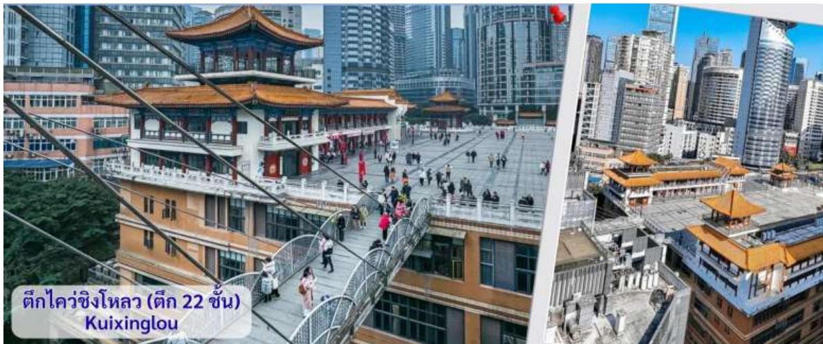
ตึกไควซิงโหลว (ตึก 22 ชั้น) Kuixinglou

จากนั้นอิสระถ่ายรูปหน้าตึกตะเกียบ ฉงชิ่ง(ด้านนอก) คือ ฉงชิ่งกั๋วไถ่อาร์ตเซ็นเตอร์ (Chongqing Guotai Arts Center) เป็นแลนด์มาร์กสำคัญที่มีสถาปัตยกรรมคล้ายตะเกียบยักษ์สีแดงและด่างวางซ้อนกัน เป็นศูนย์จัดแสดงงานศิลปะและสถานที่ท่องเที่ยวที่นิยมสำหรับการถ่ายรูป โดยเฉพาะในเวลากลางคืนเมื่อเปิดไฟสวยงาม สิ่งก่อสร้างอันมีเอกลักษณ์ อาคารนี้ถูกวางโครงสร้างให้มีรูปร่างคล้ายกอง "ตะเกียบยักษ์" สีดำและแดงที่วางซ้อนกันเป็นชั้นๆ ที่ส่วนปลายของตะเกียบสีแดงจะมีตัวอักษรจีนคำว่า "กั๋ว" ประทับอยู่ ซึ่งมีความหมายถึง ชาตินี้หรือประเทศ ส่วนที่ปลายตะเกียบสีดำ จะมีอักษรจีนคำว่า "ไถ่" ประทับอยู่ ซึ่งหมายถึง ความเจียบสงบ หรือความอุดมสมบูรณ์