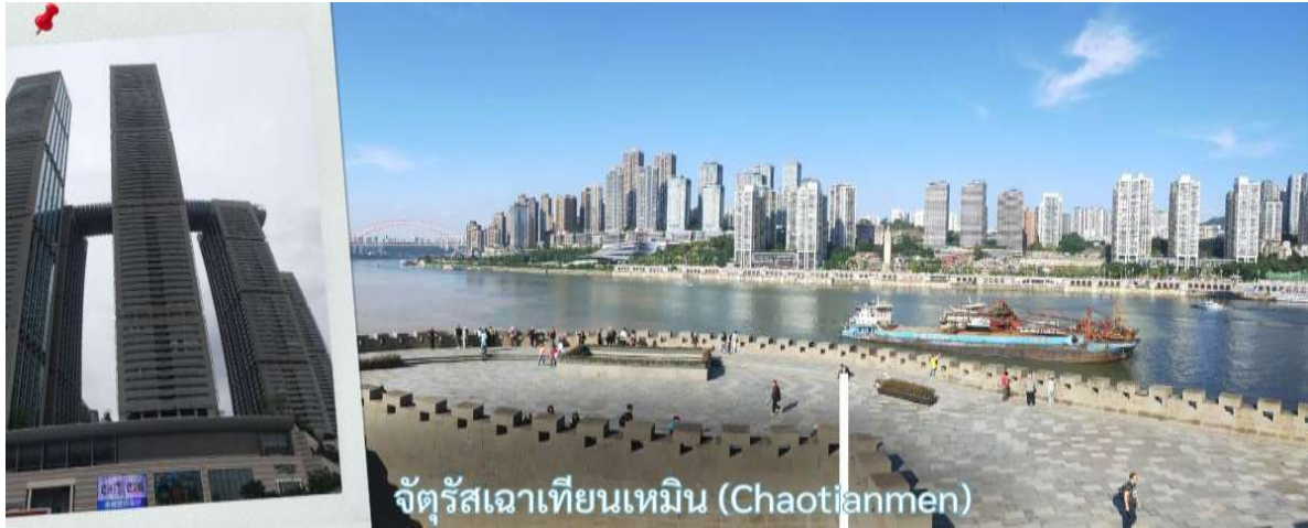
จัตุรัสเฉาเทียนเหมิน (Chaotianmen)

จุดบรรจบระหว่างแม่น้ำสองสาย โดยน้ำสีเหลืองของแม่น้ำแยงซีและน้ำสีเขียวมรกตของแม่น้ำเจียหลิงไหลมาบรรจบกันอย่างชัดเจน สร้างทัศนียภาพที่สวยงามและเป็นเอกลักษณ์ของฉงชิ่งอย่างแท้จริง