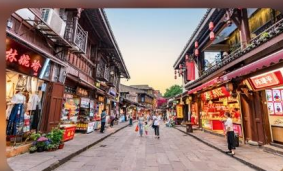
หมู่บ้านโบราณฉือซื่อ