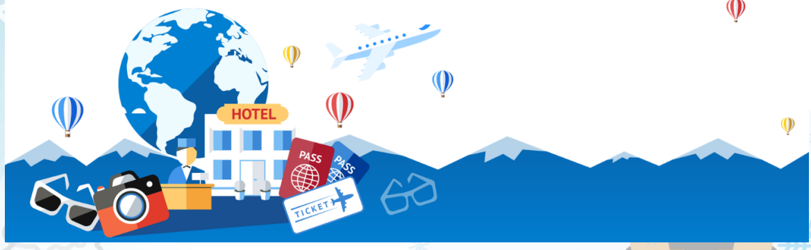
GO2CTS-TG083 -- HOKKAIDO HAKODATE SNOW WINTER 6D 4N BY TG

บริษัทฯ ขอสงวนสิทธิ์ที่จะไม่คืนค่าทัวร์ ไม่ว่ากรณีใดๆ *สำคัญ !! บริษัททำธุรกิจเพื่อการท่องเที่ยวเท่านั้น ไม่สนับสนุนการเดินทางเข้าญี่ปุ่นโดยผิดกฎหมาย ลูกค้านำต้องผ่านการตรวจคนเข้าเมืองด้วยตัวของตนเอง โดยมัคคุเทศก์ไม่สามารถช่วยเหลือใดๆได้ทั้งสิ้น *