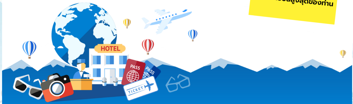
GO2CTS-TG083 -- HOKKAIDO HAKODATE SNOW WINTER 6D 4N BY TG

สำคัญ!! กรุณาอ่านเงื่อนไข แนบท้ายโดยละเอียด เพื่อประโยชน์สูงสุดของท่าน