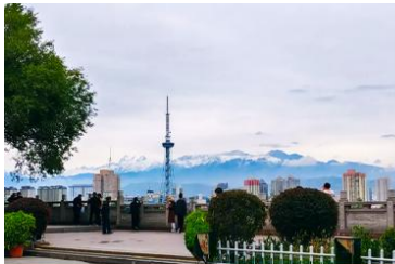
สวนสาธารณะหงชาน

โบราณนี้สร้างขึ้นในช่วงศตวรรษที่สองก่อนคริสตกาลโดยการขุดเจาะลงไปใต้พื้นดิน ภายในมีสิ่งปลูกสร้างโบราณที่มีคุณค่าทางประวัติศาสตร์ อาทิ กำแพง ป้อมปราการ ศาลาวัด และป้อมเจดีย์ ฯลฯ จากนั้นนำท่านเดินทางโดยรถบัสสู่เมือง เมืองอูรูมูฉี 乌鲁木齐 (ระยะทาง 180 กม. ใช้เวลาเดินทางราว 2 ชั่วโมงครึ่ง)