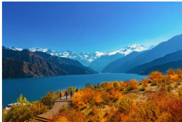
อุทยานธรรมชาติเทือกเขาเทียนชาน

รับประทานอาหารเช้า ณ ห้องอาหารของโรงแรม (7)