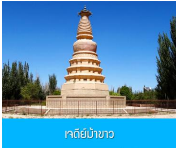
เจดีย์ม้าขาว