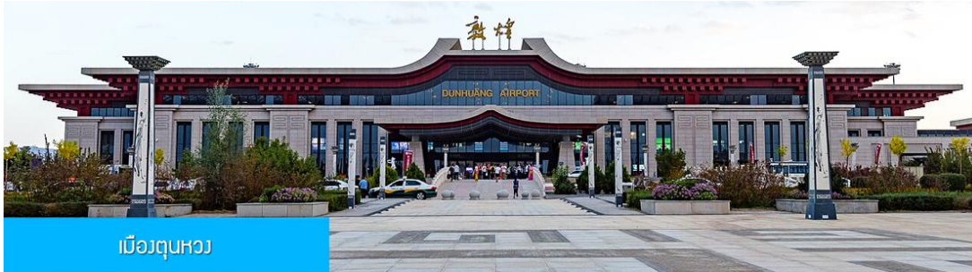
เมืองตุนหวง

** ชำระค่าทัวร์ในนามบริษัท ไลออน ทราเวล จำกัด เท่านั้น **