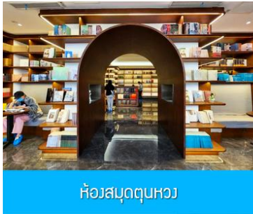
ห้องสมุดคูนหวง