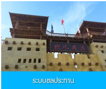
ระบบชลประทาน