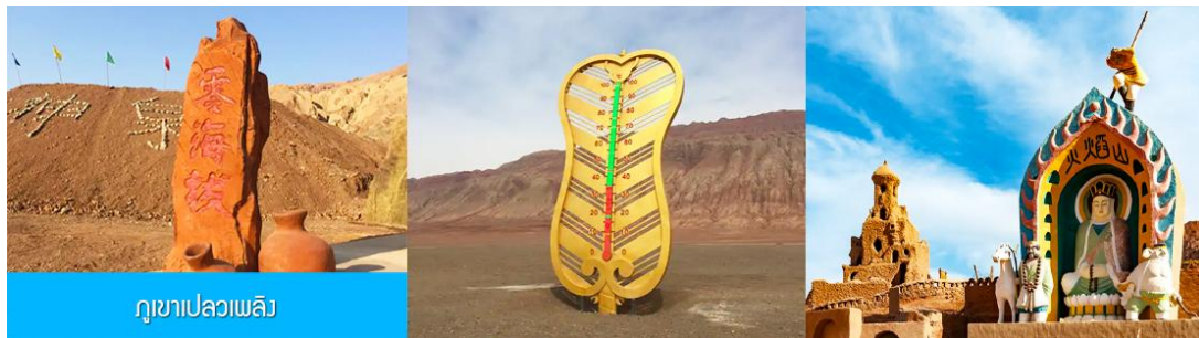
ภูเขาเปลวเพลิง

เช้า รับประทานอาหารเช้า ณ ห้องอาหารของโรงแรม (4)