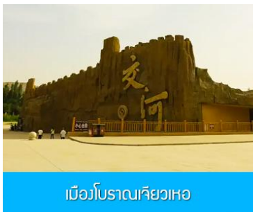
เมืองโบราณเจียวเหอ