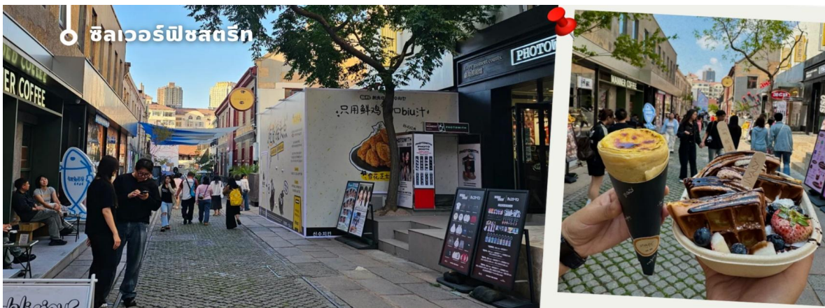
ซิลเวอร์ฟิชสตรีท

นำทุกท่านเดินทางไปเช็คอิน ซิลเวอร์ฟิชสตรีท (Silverfish Street) ตรอกประวัติศาสตร์สุดฮิตในย่านเมืองเก่าซิงเต่า ที่ได้รับการบูรณะจากย่านเก่าอายุกว่าร้อยปีให้กลายเป็นแหล่งรวมคาเฟ่ ร้านอาหาร และร้านค้าสไตล์สร้างสรรค์ ภายใต้งค์กรรักษาอาคารหือย่านอันเป็นเอกลักษณ์ของซิงเต่าเอาไว้ได้อย่างงดงาม นักท่องเที่ยวสามารถเดินเล่น ถ่ายภาพ ซุปปิ้ง และสัมผัสบรรยากาศการผสมผสานระหว่างประวัติศาสตร์และความทันสมัยได้อย่างลงตัว จนได้รับการยกย่องให้เป็นหนึ่งในย่านสุดชิคและจุดเช็คอินยอดนิยมของเมืองซิงเต่าในปัจจุบัน