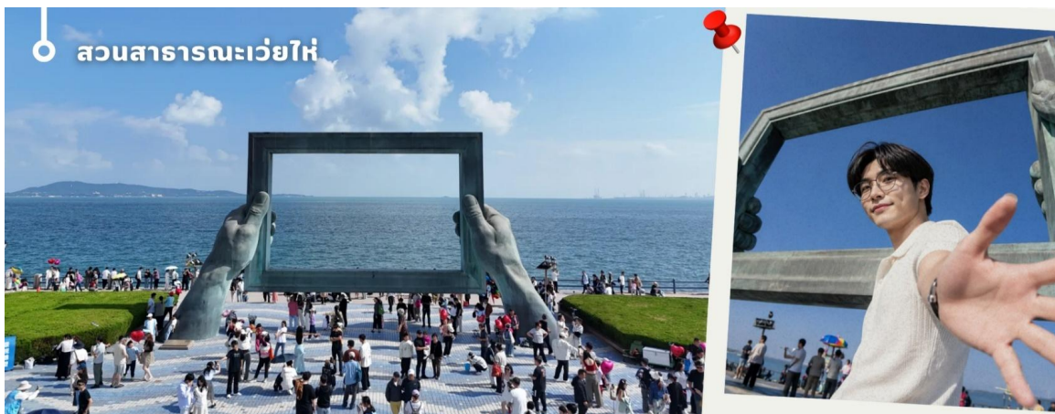
CVZYNT02 เยียนไถ -เว่ยไห่ -ชิงเต่า 5วัน 4คืน VZ VietjetAir (เทศกาลเปียร์นานาชาติ)

นำท่านเที่ยวชม สวนสาธารณะเว่ยไห่ (ประตูแห่งความสุข+กรอปรูป) แลนด์มาร์กสำคัญริมทะเลของเมือง ชม "ประตูแห่งความสุข" สัญลักษณ์แห่งความโชคดีและความสมหวังที่ใหญ่ที่สุดของเว่ยไห่ พร้อมเก็บภาพความประทับใจกับกรอปรูปวิวทะเลสุดโรแมนติก ซึ่งเป็นอีกหนึ่งจุดเช็คอินยอดนิยมที่ไม่ควรพลาด ท่ามกลางบรรยากาศอันงดงามของท้องทะเลสีครามที่สวยงาม