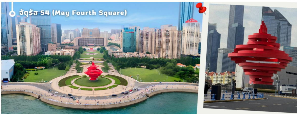
จัตุรัส 54 (May Fourth Square)

นำท่านเดินทางสู่ จัตุรัส 54 แลนด์มาร์กสำคัญและสัญลักษณ์ประจำเมืองชิงเต่า ตั้งอยู่ริมอ่าวฝูซาน โดดเด่นด้วยประติมากรรมสี่แดงขนาดยักษ์ "สายลมแห่งเดือนพฤษภาคม" ซึ่งสร้างขึ้นเพื่อรำลึกถึงขบวนการ 4 พฤษภาคม อันเป็นเหตุการณ์สำคัญในประวัติศาสตร์จีน นักท่องเที่ยวสามารถเดินเล่นริมทะเล ชมวิวเมืองสมัยใหม่ และสัมผัสบรรยากาศอันสวยงามของอ่าวชิงเต่า โดยเฉพาะในช่วงค่ำที่มีการเปิดไฟประดับทั่วบริเวณ ถือเป็นจุดชมวิวและถ่ายภาพที่มีชื่อเสียงที่สุดแห่งหนึ่งของเมืองชิงเต่า