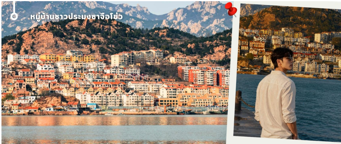
หมู่บ้านชาวประมงซาโจโซ่

นำท่านเดินทางสู่ จัตุรัส 54 แลนด์มาร์กสำคัญและสัญลักษณ์ประจำเมืองชิงเต่า ตั้งอยู่ริมอ่าวฝูซาน โดดเด่นด้วยประติมากรรมสี่แดงขนาดยักษ์ "สายลมแห่งเดือนพฤษภาคม" ซึ่งสร้างขึ้นเพื่อรำลึกถึงขบวนการ 4 พฤษภาคม อันเป็นเหตุการณ์สำคัญในประวัติศาสตร์จีน นักท่องเที่ยวสามารถเดินเล่นริมทะเล ชมวิวเมืองสมัยใหม่ และสัมผัสบรรยากาศอันสวยงามของอ่าวชิงเต่า โดยเฉพาะในช่วงค่ำที่มีการเปิดไฟประดับทั่วบริเวณ ถือเป็นจุดชมวิวและถ่ายภาพที่มีชื่อเสียงที่สุดแห่งหนึ่งของเมืองชิงเต่า