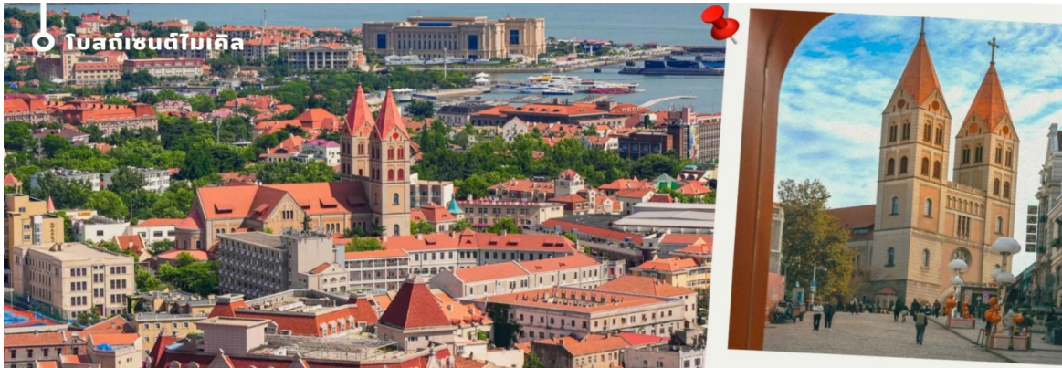
โบลต์เซนต์ไมเกิล

นำทุกท่านเดินทางไปเช็คอิน ซิลเวอร์ฟิชสตรีท (Silverfish Street) ตรอกประวัติศาสตร์สุดฮิตในย่านเมืองเก่าซิงเต่า ที่ได้รับการบูรณะจากย่านเก่าอายุกว่าร้อยปีให้กลายเป็นแหล่งรวมคาเฟ่ ร้านอาหาร และร้านค้าสไตล์สร้างสรรค์ ภายใต้งค์กรรักษาอาคารหือย่านอันเป็นเอกลักษณ์ของซิงเต่าเอาไว้ได้อย่างงดงาม นักท่องเที่ยวสามารถเดินเล่น ถ่ายภาพ ซุปปิ้ง และสัมผัสบรรยากาศการผสมผสานระหว่างประวัติศาสตร์และความทันสมัยได้อย่างลงตัว จนได้รับการยกย่องให้เป็นหนึ่งในย่านสุดชิคและจุดเช็คอินยอดนิยมของเมืองซิงเต่าในปัจจุบัน