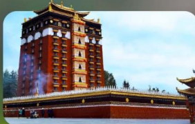
หอฟพระมิลเรอปา