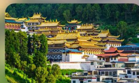
วัดหล่างมูซือ