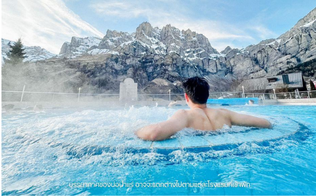
บรรยากาศของบ่อน้ำแร่ อาจจะแตกต่างกันไปตามแต่ละโรงแรมที่เข้าพัก

บรรยากาศจริงจะมีความแตกต่างไปในแต่ละฤดูกาลท่องเที่ยว