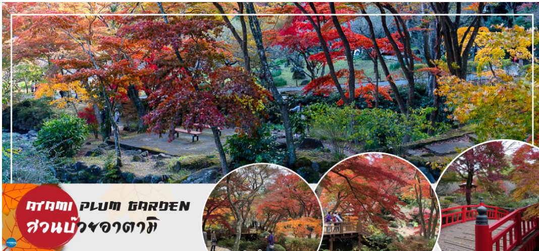
ATAMI PLUM GARDEN สวนบ๊วยอาตามิ

เที่ยง รับประทานอาหารกลางวัน ณ ภัตตาคาร (3)