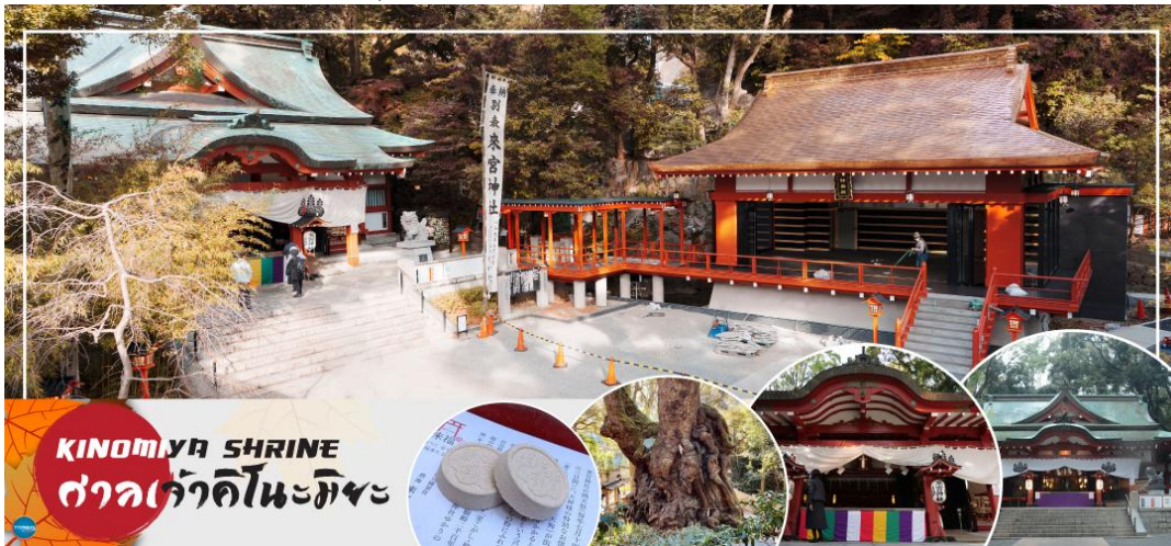
KINOMIYA SHRINE ศาลเจ้าคิโนะมิยะ

เพราะที่นี่ถือเป็นสิ่งสถิตของเทพเจ้าทั้งหลาย ซึ่งในปัจจุบันที่นี้ถือเป็นตัวแทนของศาลเจ้าคิโนะมิยะทั้ง 44 ศาลเจ้าทั่วประเทศ เป็นศูนย์รวมของความเคารพบูชา นอกจากนี้ยังมีอนุสาวรีย์ธรรมชาติแห่งชาติ และยังมีต้นไม้ยักษ์ขนาดเส้นผ่านศูนย์กลาง 24 เมตร ตั้งอยู่ในสุดเขตวัด ว่ากันว่าหากเดินวนรอบต้นไม้หนึ่งรอบ อายุก็จะยาวขึ้นไปอีกหนึ่งปีแม้ที่นี่จะดูน่าเกรงขามแต่พอเข้าไปกลับรู้สึกอุ่นใจ ผู้ที่มาขอให้ตนสามารถเลิกเหล้า เลิกบุหรี่ให้สำเร็จก็มีมาก และยังมีเครื่องรางความรักสุดน่ารักวางขายอีกด้วย