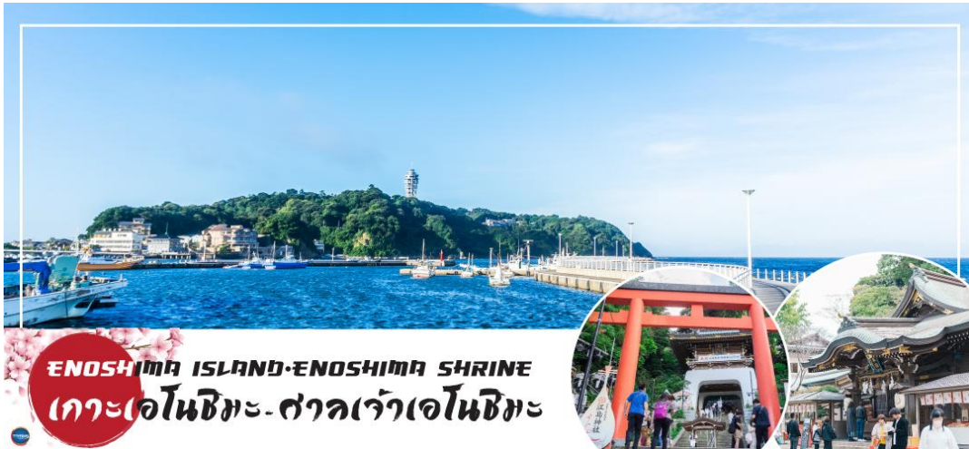
ENOSHIMA ISLAND-ENOSHIMA SHRINE เกาะเอโนชิมะ-ศาลเจ้าเอโนชิมะ

วันที่สอง ทำอากาศยานนานาชาตินาริตะ - จังหวัดคานางาวะ - เกาะเอโนชิมะ - ศาลเจ้าเอโนชิมะ - ถนนเบนไซเท็นนากามิสะ - จังหวัดยามานาชิ - หมู่บ้านโอชิโนะฮัคโค - ออนเซ็น + ซาปายักษ์