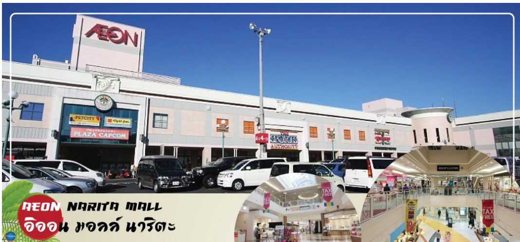
AEON NARITA MALL อียอน มอลล์ นาริตะ

จากนั้นเดินทางสู่ อียอน มอลล์ นาริตะ (Aeon Narita Mall) ห้างสรรพสินค้าที่นิยมในหมู่นักท่องเที่ยวชาวต่างชาติ เนื่องจากตั้งอยู่ใกล้กับสนามบินนานาชาตินาริตะ ภายในตกแต่งในรูปแบบที่ทันสมัยสไตล์ญี่ปุ่น มีร้านค้าที่หลากหลายมากกว่า 150 ร้านจำหน่ายสินค้าแฟชั่น อาหารสดใหม่ และอุปกรณ์ภายในบ้าน นอกจากนี้ยังมีร้านเสื้อผ้าแฟชั่นมากมาย เช่น MUJI, 100 yen shop, Sanrio store, Capcom games arcade และซูปเปอร์มาร์เก็ตขนาดใหญ่