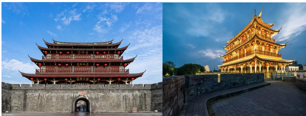
ค้ำ รับประทานอาหารค้ำ ณ ภัตตาคาร

ข้ามแม่น้ำหนานเจียง (Han River) ที่มีความเก่าแก่และเป็นเอกลักษณ์ระดับโลก โดยเป็นสะพานเปิด-ปิดได้แห่งแรกของโลก และมีศาลาไม้ตั้งอยู่บนตัวสะพานอย่างสวยงาม ก่อนที่จะปิดท้ายด้วย ถนนคนเดินไผ่ฟาง (Paifang Street) ถนนสายหลักในเมืองโบราณที่เรียงรายไปด้วยซุ้มประตูหินโบราณ ร้านค้า ร้านอาหาร และอาคารสไตล์จีนดั้งเดิมที่ผสมผสานกันอย่างคลาสสิก หลังจากนั้น