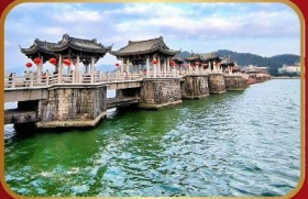
หมู่บ้านโบราณหลงหู