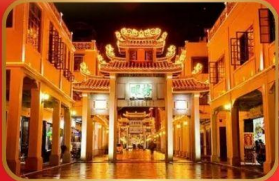
ถนนคนเดินไฟฟาง