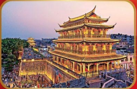
เมืองโบราณเจาโจว