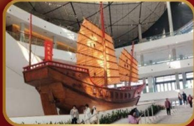
พิพิธภัณฑ์เมืองเจาซาน