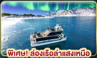
พิเศษ! ล่องเรือลำแสงเหนือ