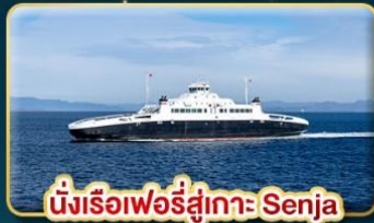
นั่งเรือเฟอร์รี่สู่เกาะ Senja