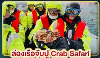
ล่องเรือจับปู Crab Safari

เยือนเมืองหลวงแห่งแสงเหนือ สัมผัสความสวยงามของนอร์เวย์ที่แท้จริง